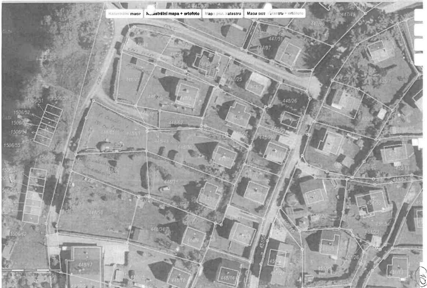
Oběh katastrální mapy a mapy pozemkového katastru se zobrazuje od měřítka 1:5000. Podrobnější informace k používání mapy a aktualizaci jejího obsahu najdete v návodu (PDF) . Velikost zobrazení hodnoty souřadnic a délky NELZE využívat pro vyřevování hranice pozemků v terénu.